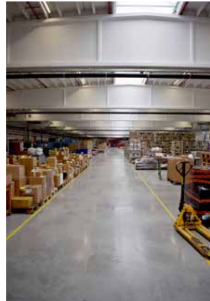
Het grondplan van het logistiek centrum is erg eenvoudig.