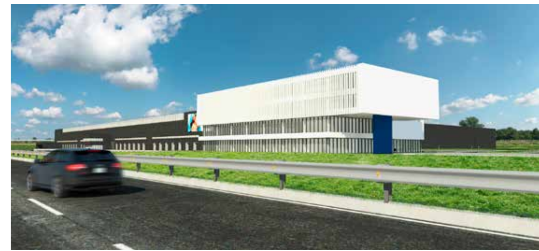
Het kantorencomplex bestaat uit vier bouwlagen, waarvan de bovenste twee een aantal meter uitspringen aan de linkerzijde.

Het nieuwe hoofdkwartier en het Europese distributiecentrum vormen één volume, maar kregen elk hun eigen identiteit. Het kantorencomplex bestaat uit vier bouwlagen, waarvan de bovenste twee een aantal meter uitspringen aan de linkerzijde. Alle niveaus zijn bijna volledig ingevuld met glas. De rest bestaat uit gladde, wit geschilderde prefabbetonpanelen. Op deze manier wordt het contrast met de magazijnen extra in de verf gezet. De wanden van het logistieke centrum zijn immers afgewerkt met afgewassen silexbeton in antracietkleur. Een eenvoudige architectuur met veel gesloten vlakken kenmerkt dit deel van het nieuwe gebouw. Plaatselijk telt het logistieke centrum vier